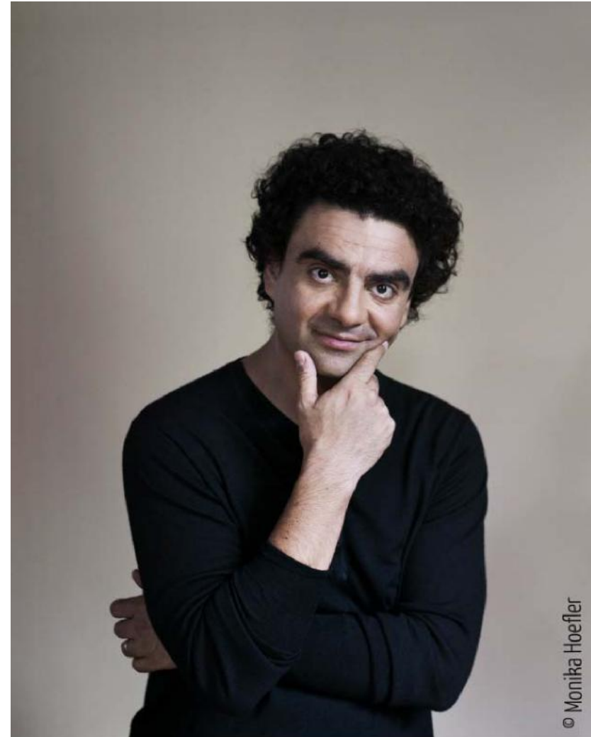
Rolando Villazón, parrain de l'association « Clowns Z'hôpitaux »

Cette année Rolando Villazón sera aux côtés des Clowns pour plusieurs de leurs visites mais sera également un porte-parole de choix auprès des médias et institutions. Sa voix reconnue dans le monde entier et son engagement sincère et entier sont un beau cadeau pour l'association et l'action menée par ses Clowns.